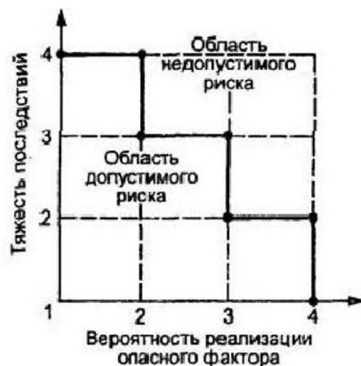
Таблица анализов риска при приготовлении и потреблении блюд.