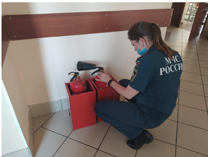
Управление по Центральному району Главного управления МЧС России по г. Санкт-Петербургу 16.06.2021